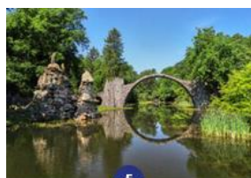
Kromlau- Rhododendronpark Kromlau