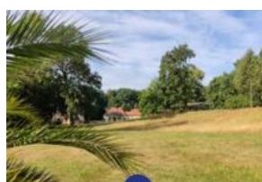
Bad Muskau. Hermannsbad