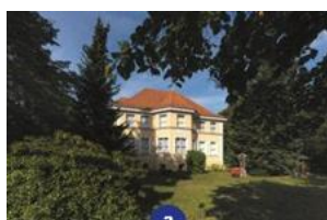
Weifwasser- Glasmuseum Weifwasser