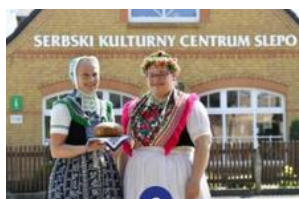
Schleife- Sorbisches Kulturzentrum Schleife