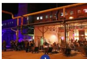
Weifwasser- Soziokulturelles Zentrum Telux